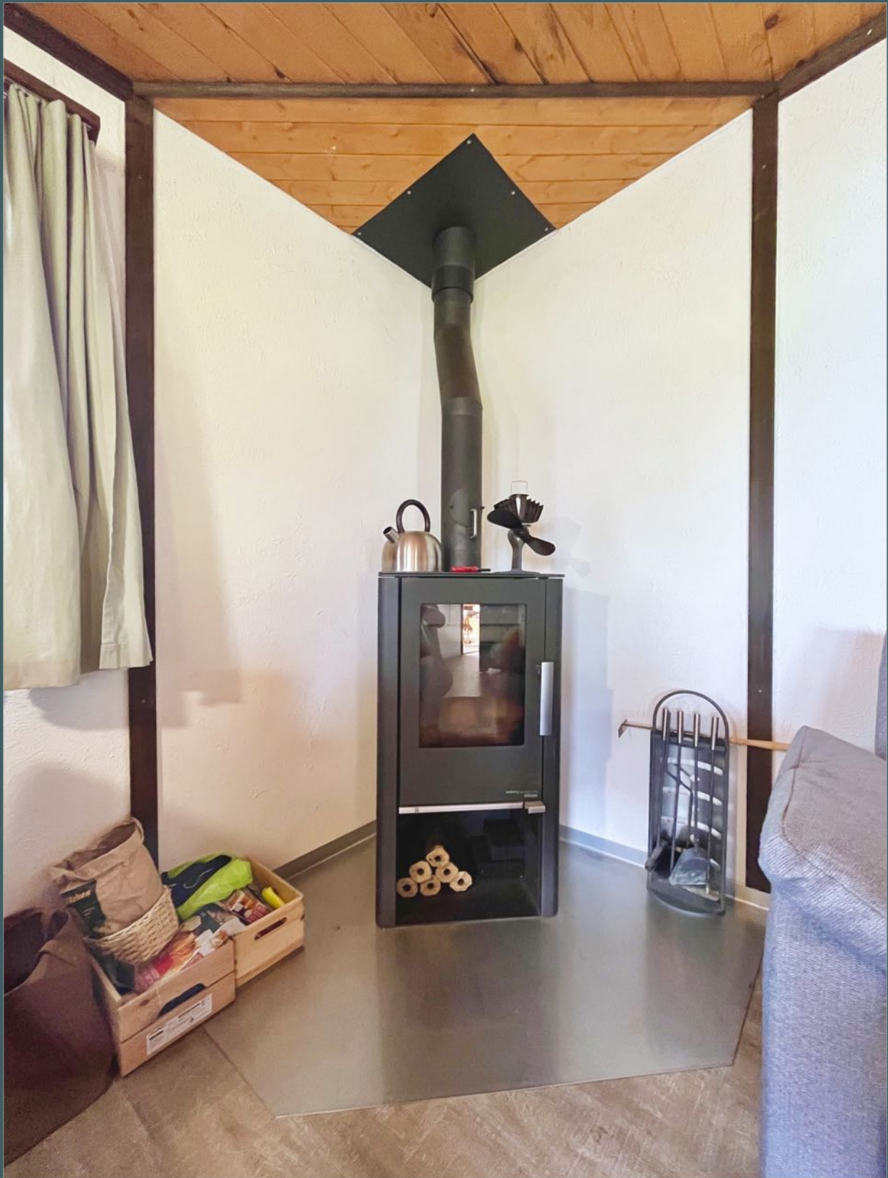
Ein Haas+ Sohn Kaminofen