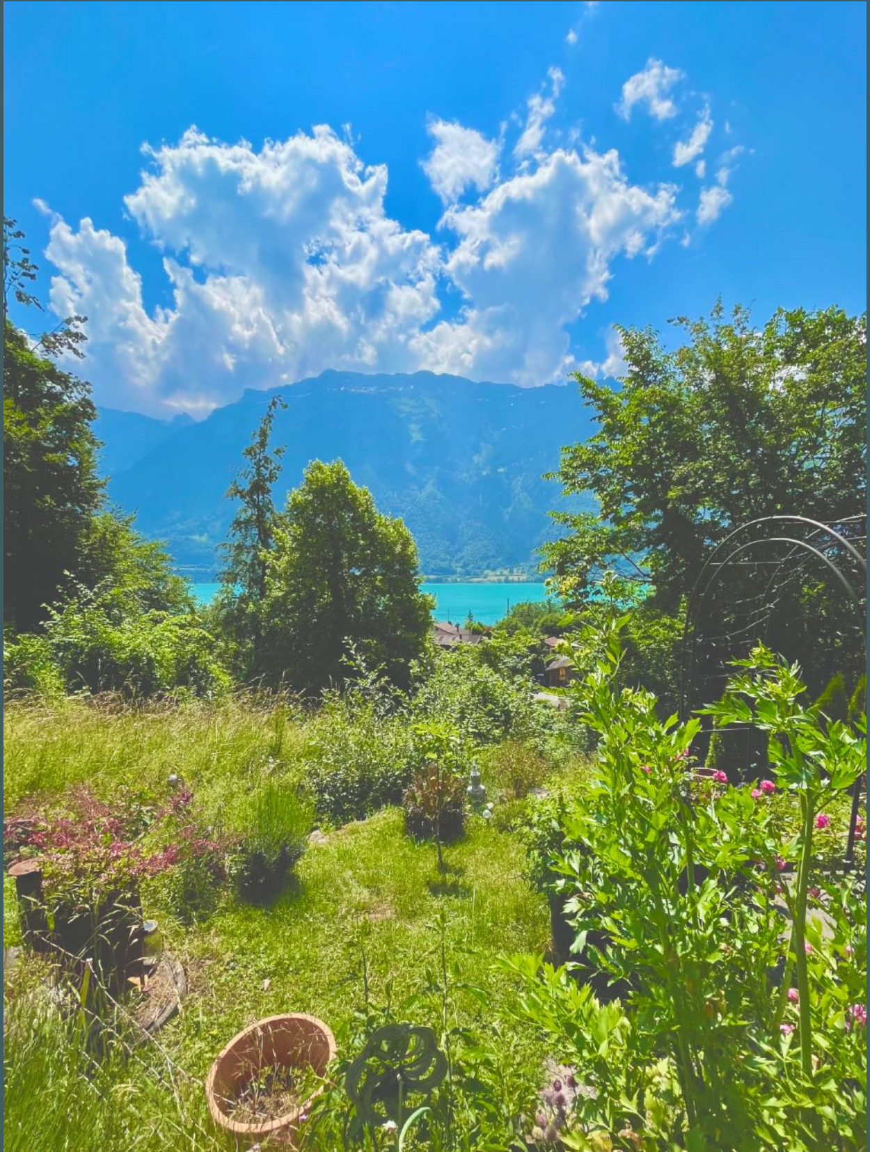
Das eigene Stück Garten