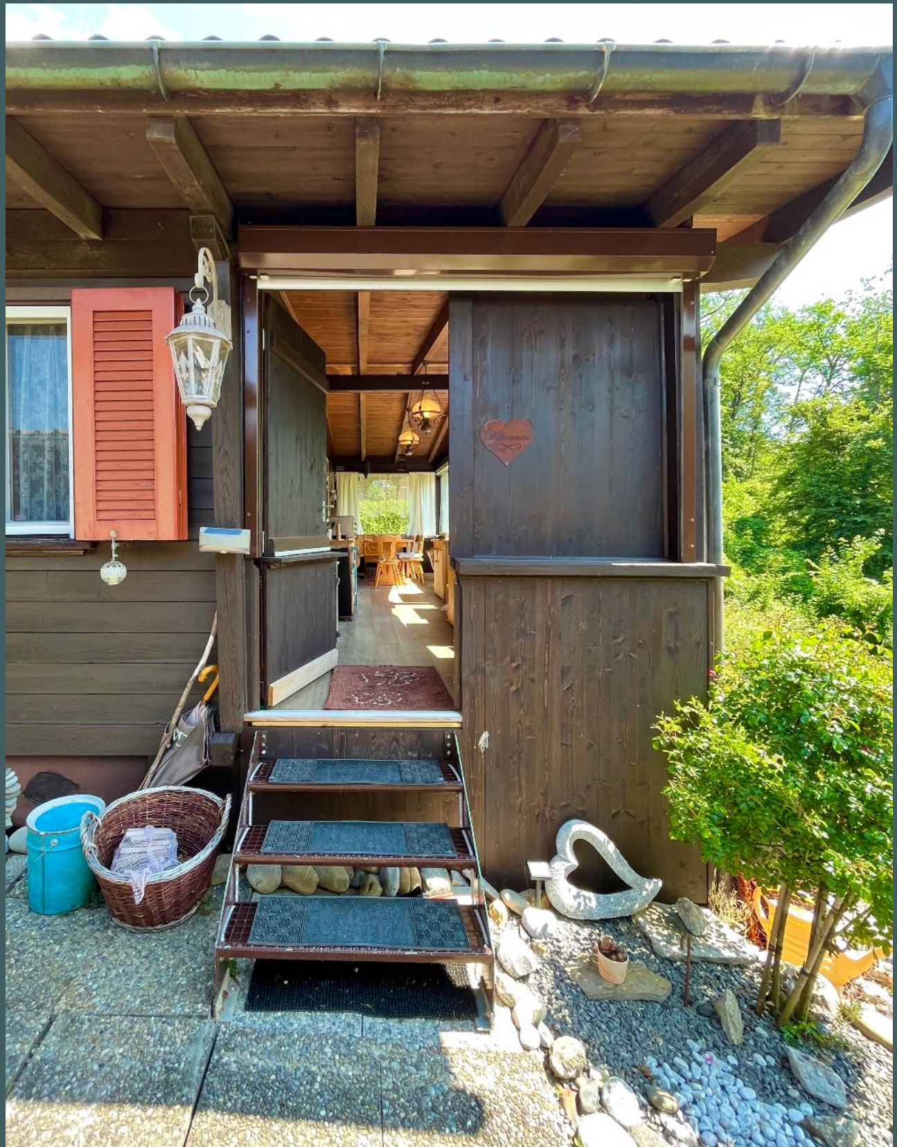
Eingang zum Tiny House