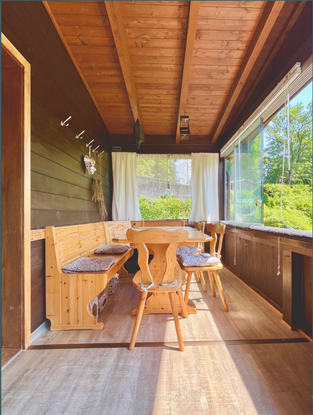
Der Essecken im Wintergarten