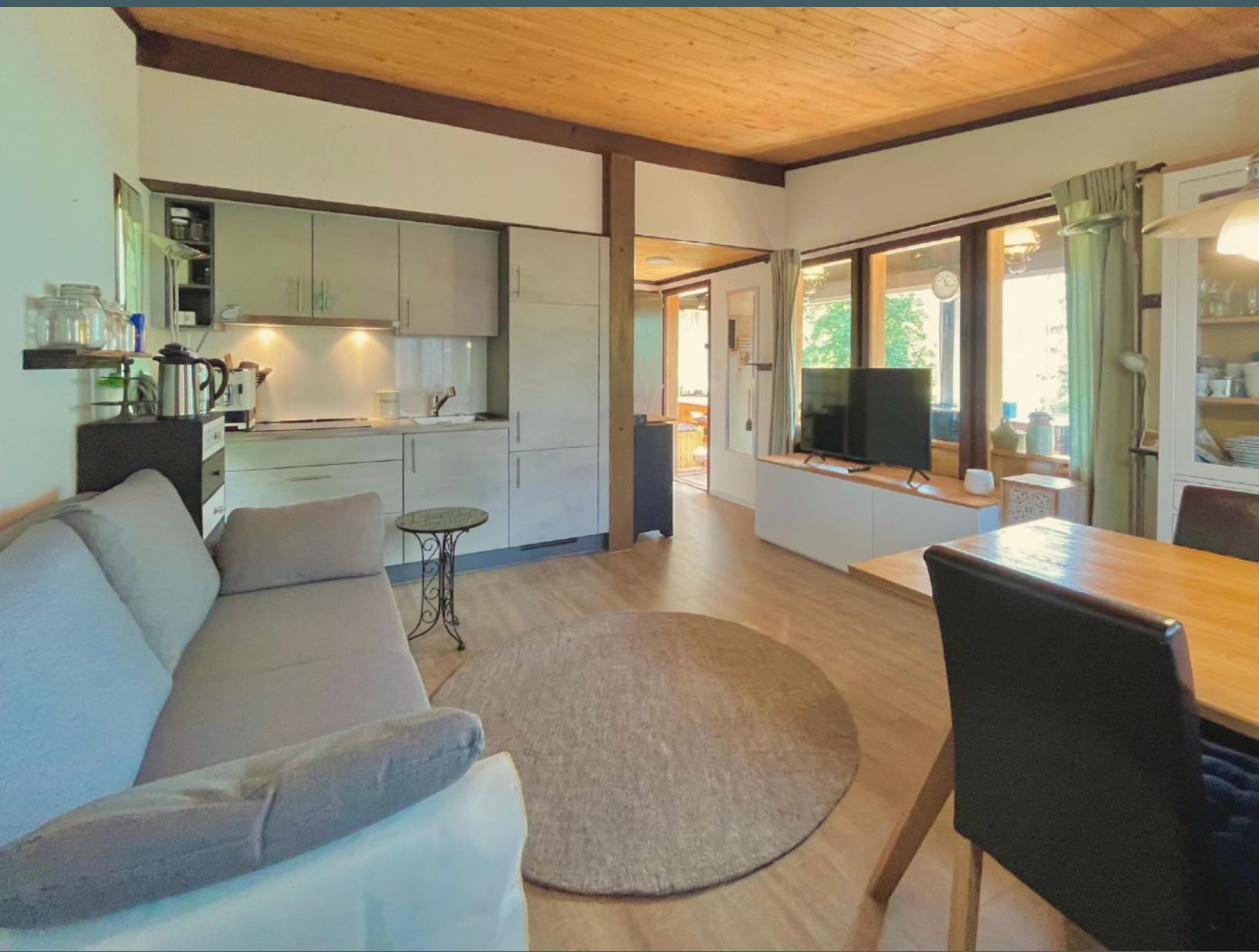
Wohnzimmer mit Blick Richtung Eingang