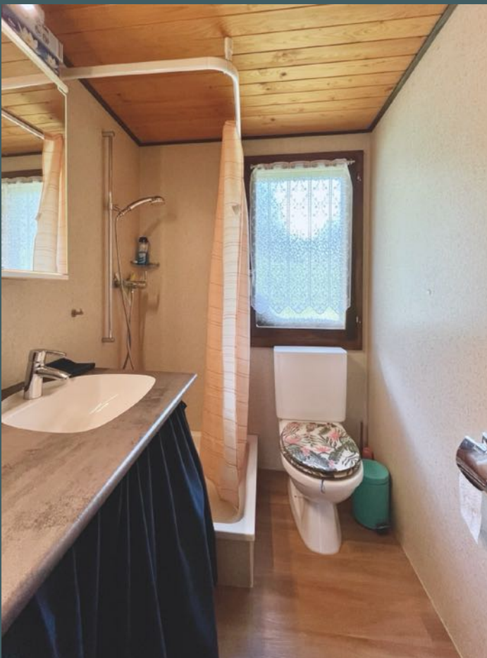
Die überraschend geräumige Dusche