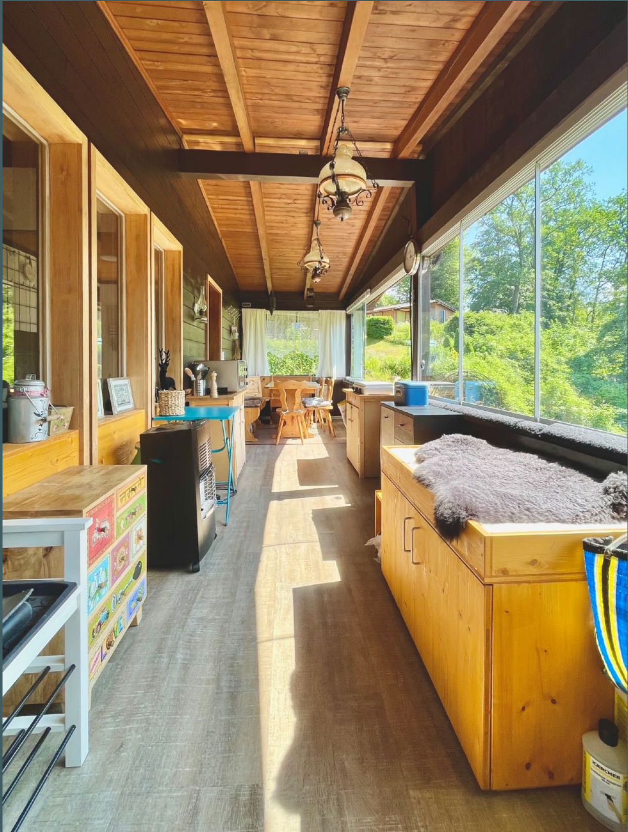
Der lichtdurchflutete Balkon bzw. Wintergarten