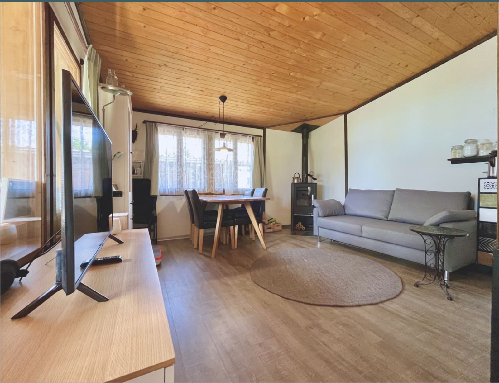
Wohnzimmer vom Eingangsbereich aus betrachtet